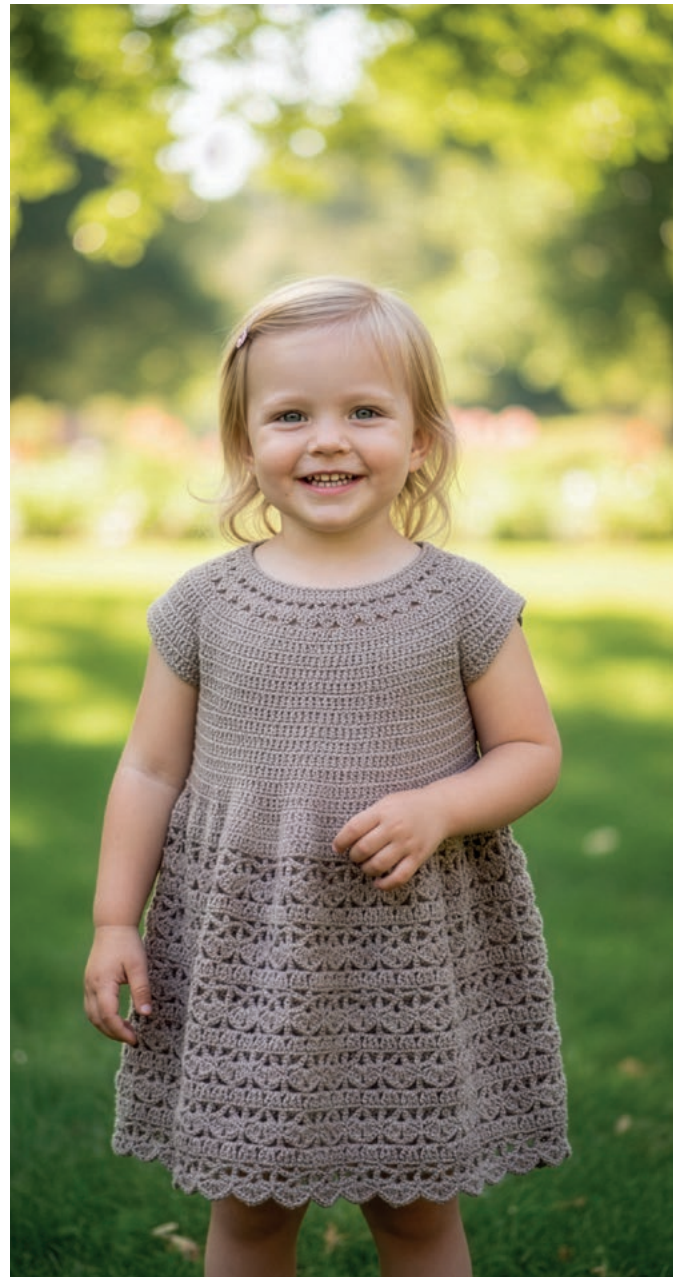
Foto: Google Gemini. Bilderna i detta mönster är AI-genererade och personen på bilden finns inte i verkligheten.

lm = luftmaska, fm = fast maska, hst = halvstolpe, st = stolpe, sm = smygmaska, v = varv